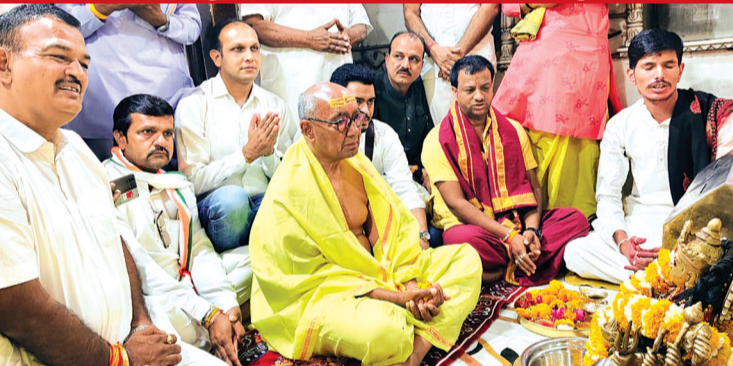
हरिभूमि न्यूज | नलखेड़ा

मां बगलामुखी के दर्शन कर किया हवन-अनुष्ठान